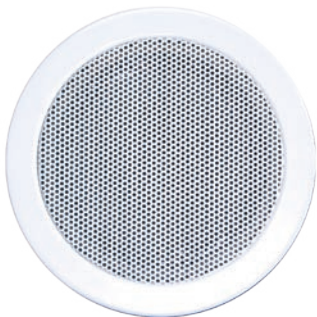
WDR-130-CX6 / CX10 / CX15